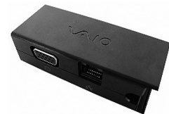
SONY VAIO 等